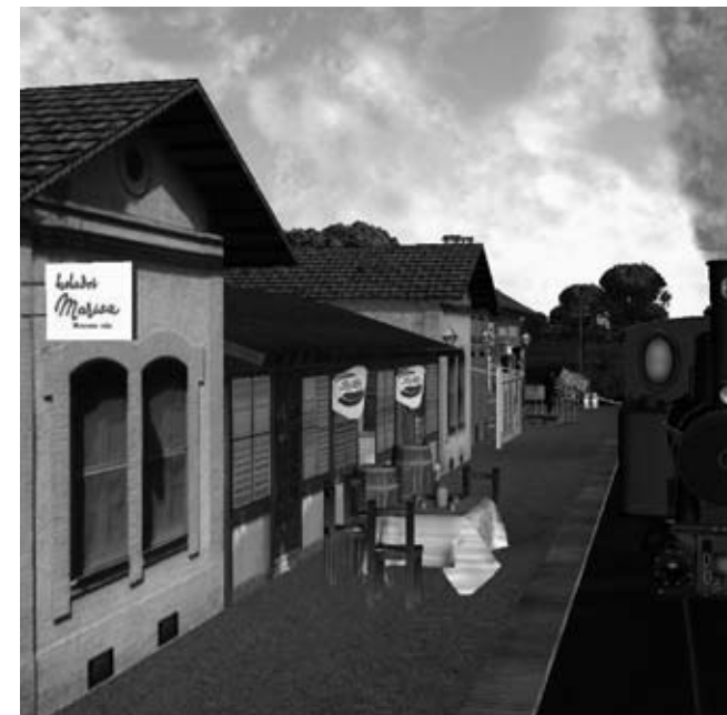
Imatges capturades a partir de la recreació virtual del tren.

Tot el recorregut del tren s'ha intentat fer al màxim de realista, començant pel terreny per on circulava. Per a aquesta tasca, hem utilitzat arxius de satèl·lits per extreure el terreny en tres dimensions, i per a conformar la via, ens hem servit dels plànols parcel·-