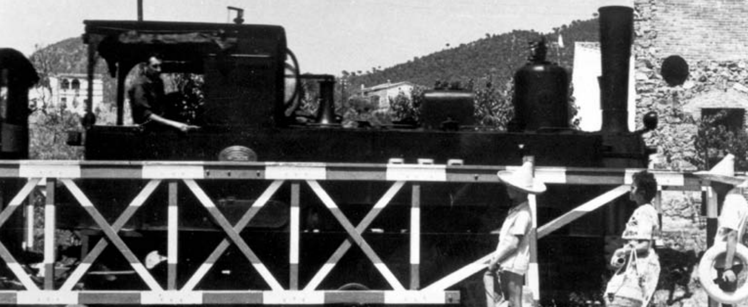
Barrera de Castell d'Aro a la carretera de S'Agaró a la dècada dels anys 1960.