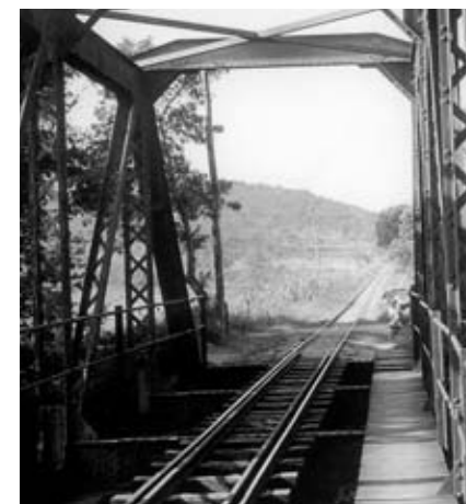
Pont del Ridaura, maig de 1967.

PRESENTACIÓ Aquest ARJAU està dedicat al tren de Sant Feliu de Guíxols. L'excusa és que el 10 d'abril d'enguany es compleixen quaranta anys del tancament de la línia. La nostra voluntat és recordar com va néixer aquest tren, per què es va extingir, el que va significar per a la ciutat i per a la seva gent... No obstant això, també volem donar a conèixer què en queda: documents, material, estructures, records, etc. I, encara més important, volem explicar què se'n pot fer, de tot aquest patrimoni, com es pot recuperar i com es pot utilitzar en benefici de la ciutat.