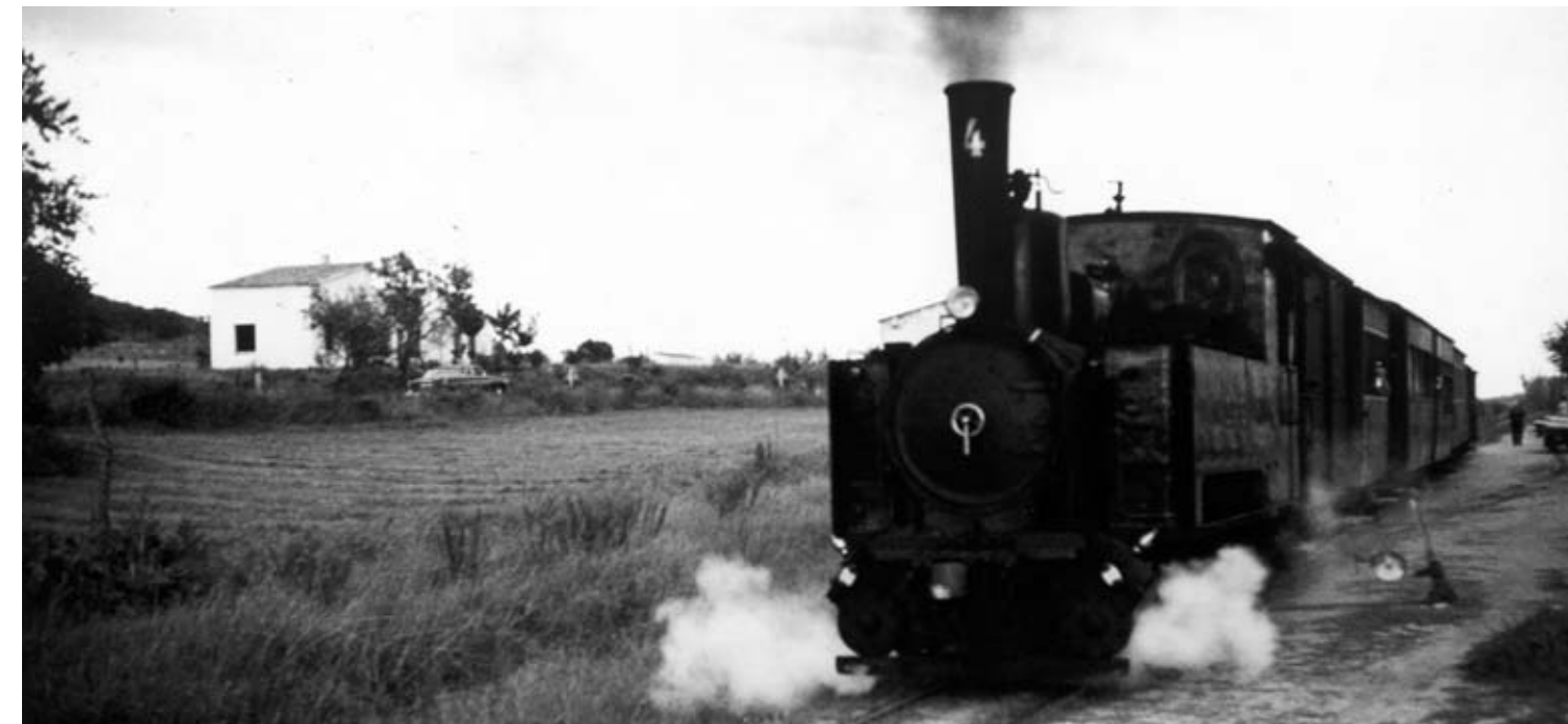
Estació de Santa Cristina d'Aro, el 30 d'agost de 1963.

doni sortida al mar, marginant zones d'influència, com una de les àrees de major creixement econòmic i turístic de la Costa Brava centre, amb prop de cent cinquanta mil habitants, set milions de visitants, dels quals una bona part –un milió– va utilitzar l'avió com a mitjà de transport i l'aeroport de Girona com a destinació. Mereixeriem, almenys, un estudi de mobilitat per connectar el port de Palamós, Calonge, Platja d'Aro, Sant Feliu de Guíxols i Santa Cristina amb l'aeroport de Girona, el futur eix transversal ferroviari i la ciutat de Girona, a través de Cassà de