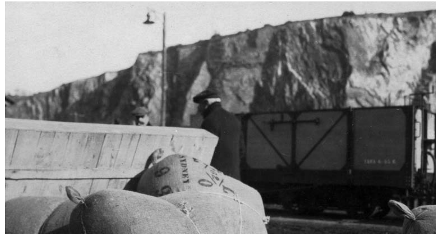
Tràfic de mercaderies al port. AMSFG. Col·lecció Espuña-Ibáñez. (Autor: desconegut)

Màster en Gestió del Patrimoni Cultural per la Universitat de Girona