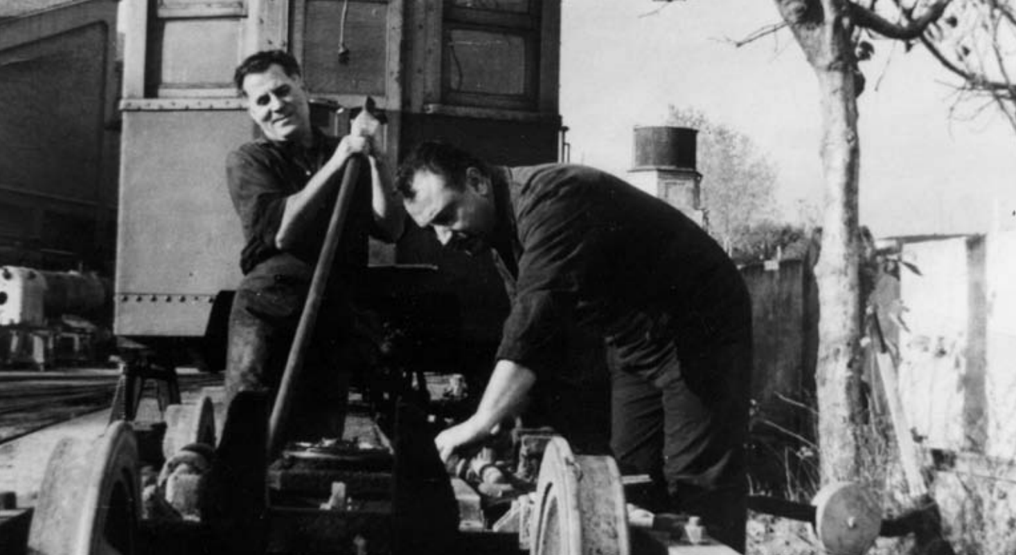
Desmantellament del tren, 1969. AM5FG. Col·lecció Moltó.